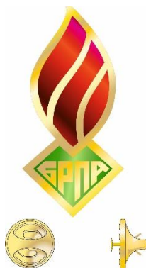
Значок «Центральный Совет»