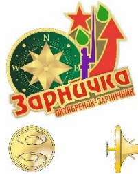
Новая визуализация БРПО, талисман БРПО